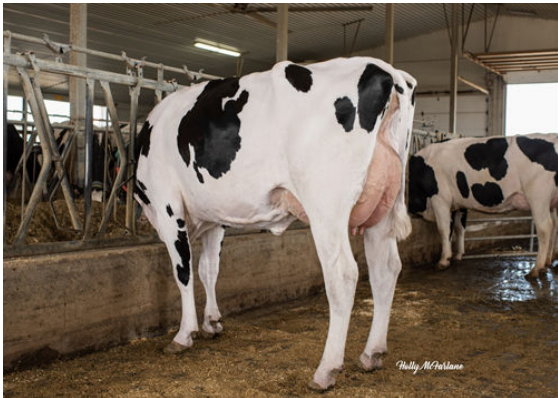
PROGENESIS TOPNOTCH BRAVE DAM