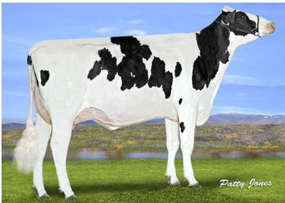
PROGENESIS MONTANA BEAUVAIS GRANDDAM